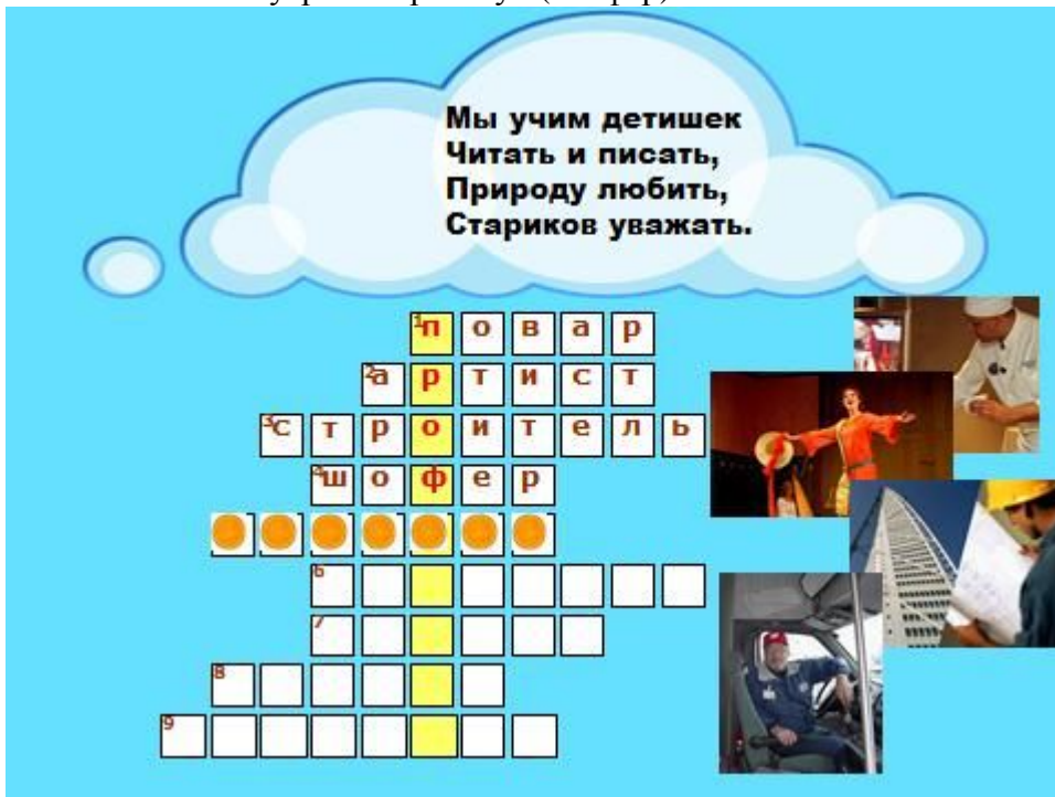
4. Мы учим детишек читать и писать, Природу любить, стариков уважать. (Учитель)