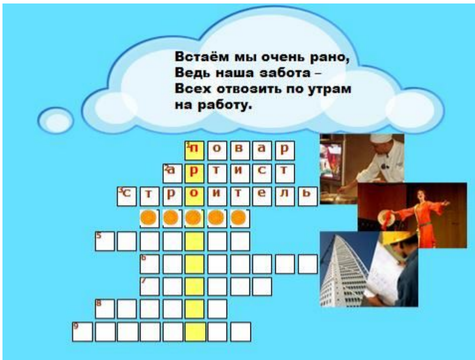
3. Встаём мы очень рано, ведь наша забота – Всех отвозить по утрам на работу. (Шофёр)