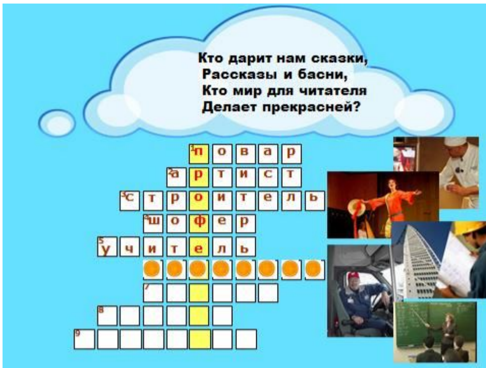
5. Кто дарит нам сказки, рассказы и басни, Кто мир для читателя делает прекрасней? (Писатель)