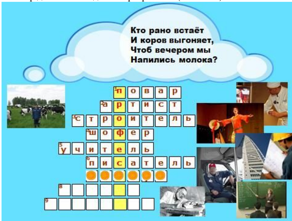
7. Кто рано встаёт и коров выгоняет, Чтоб вечером мы напились молока? (Пастух)